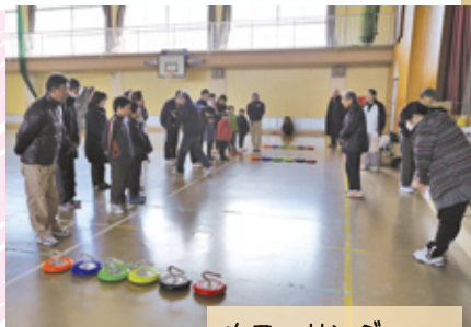
カローリング (スポーツ大会)

当部会ではそれぞれの分野での活動を実施していますが、他の部会と重複しないかと頭を悩ませています。スポーツに関しては他の部会との接点はないことから、特化した活動をしていきたいと考えています。