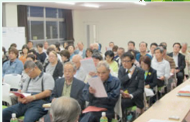
▲東部地域住民自治協議会の平成29年度総会(5月)

昨年10月から地区市民センターの改築(旧上野商業高校校舎)工事が進められてきましたが、完成し、3月17日から運営をスタートしました。旧地区市民センターと比較して広い駐車場が完備されており、利用できる部屋数も多く、今まで他施設を利用しサークル活動をしていた人たちも、便利になったことから会場を変更し、利用されるメンバーが増加したとのことです。東部地域住民自治協議会の新たな活動拠点としておおいに利用され、自治協議会が活性化することを期待します。