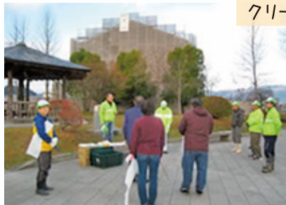
クリーンウォーク