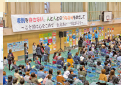
ヒューマンフェスタ