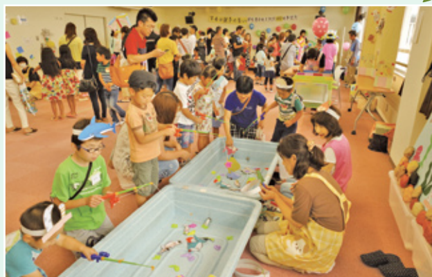
▲東部民児協主催のイベント「親子の集い」(6月)