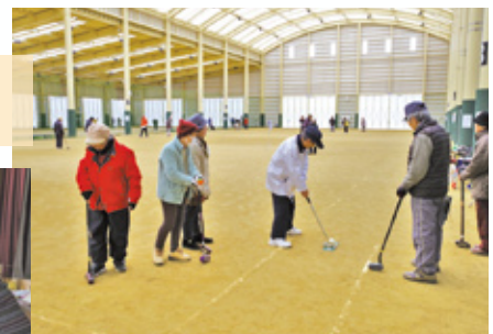
グランドゴルフ (スポーツ大会)