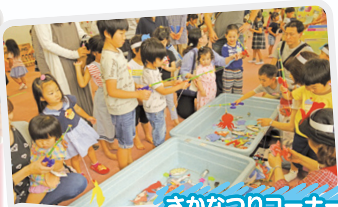
さかなつりコーナー