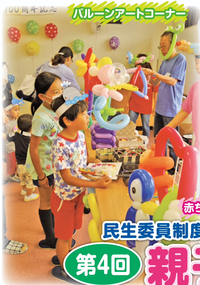
バルーンアートコーナー

2017年8月1日 発行 東部地域住民自治協議会 総務広報部会 伊賀市緑ヶ丘東町920 上野東部地区市民センター内 TEL・FAX 24-3999