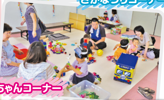
赤ちゃんコーナー