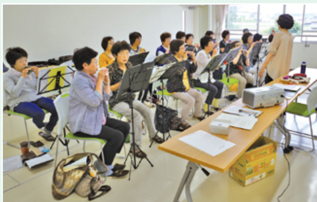
▲オカリナ演奏「きらきらぼし」のサークル活動(6月)