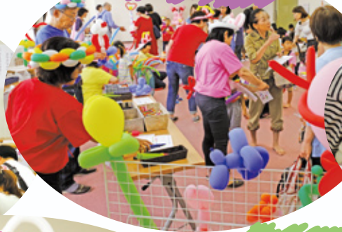
バルーンアートコーナー