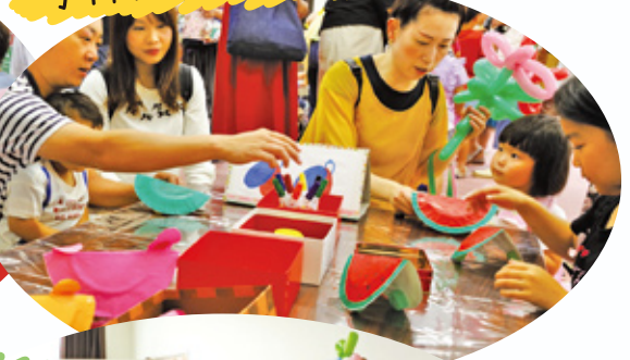
手作り楽器コーナー