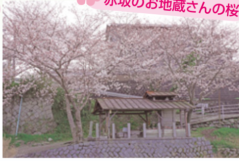
赤坂のお地蔵さんの桜