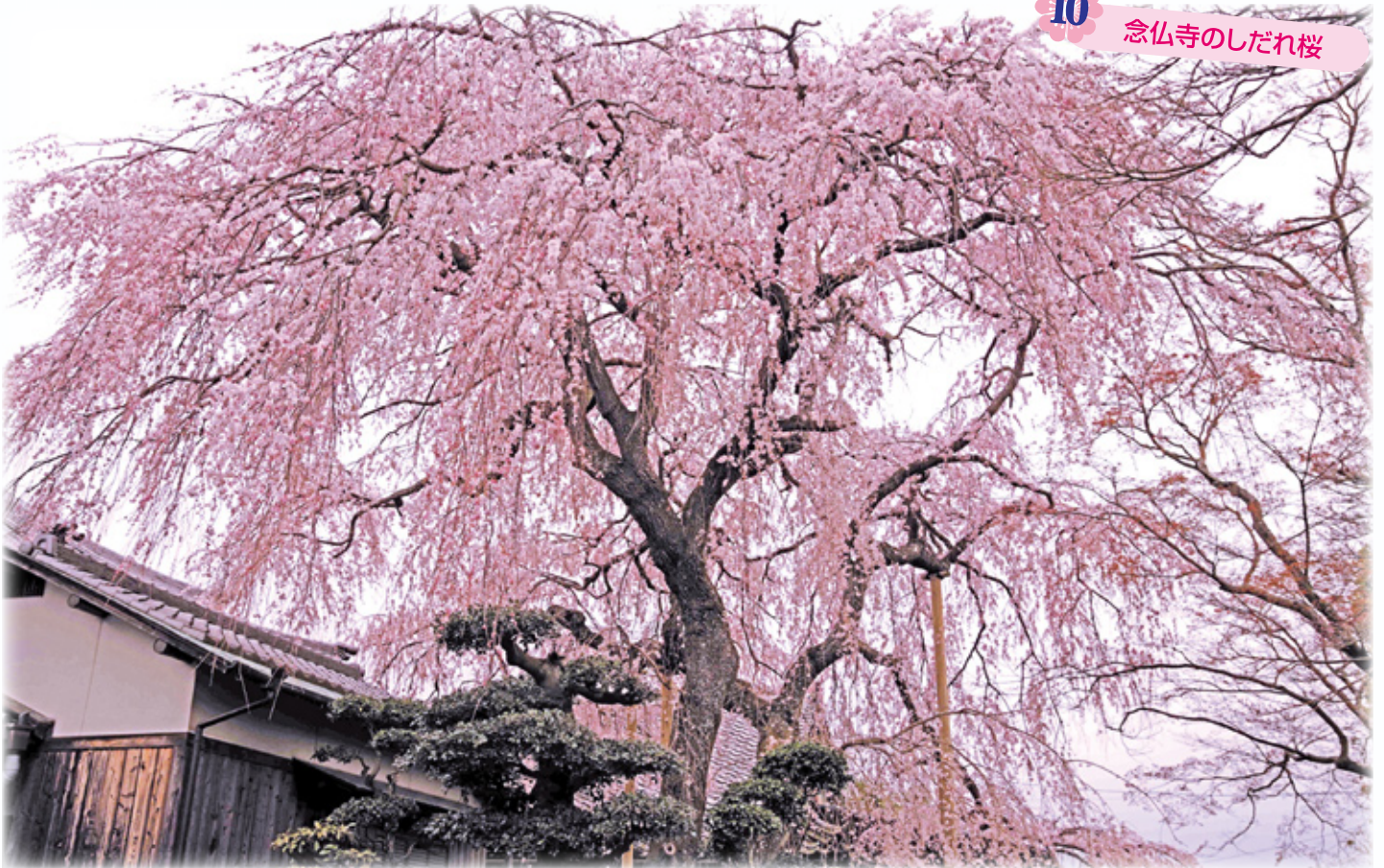
念仏寺のしだれ桜