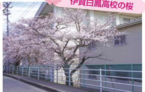
伊賀白鳳高校の桜