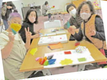
折り鶴を折る参加の皆様方

世界平和を祈念して 広島へ「折り鶴」を贈呈する予定です。 昨年、健康福祉部会主催の地域食堂へ参加の皆様方が折り始めた「折り鶴」が約500羽近くになりました。1000羽目標で頑張っております。来年の8月には、広島へ贈呈する予定です。今後も皆様方のご協力よろしくお願いたします。