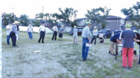
クリーンウォーク

矢谷川や市街地はきれいになってきましたが、まだまだなくなる不法投棄やタバコのポイ捨てには呆れています。「ホタルの飛び交う川!」を合言葉に清掃活動していますので、一人でも多くのご参加をお待ちしています。