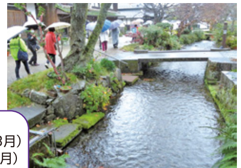
「醒井湧水めぐり」環境学習会