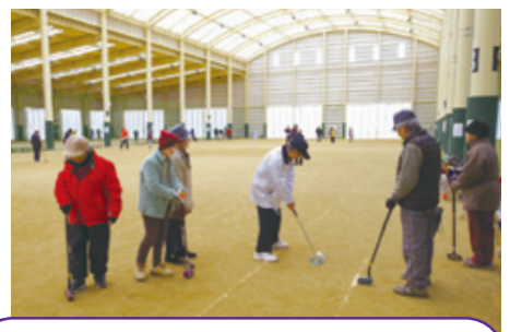
グラウンドゴルフ (スポーツ大会)