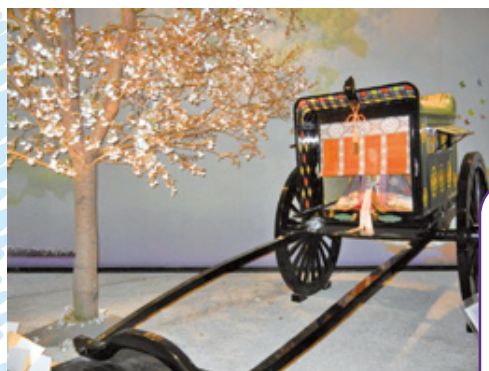
石山寺・源氏物語ミュージアム

当部会ではそれぞれの分野での活動を実施していますが、他の部会と重複しないかと頭を悩ませています。スポーツに関しては他の部会との接点はないことから、特化した活動をして行きたいと考えています。